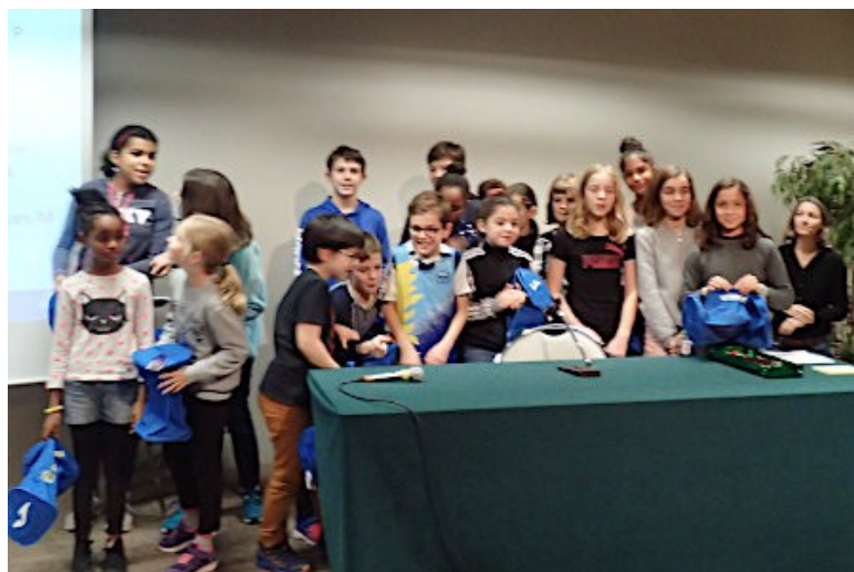
Les enfants récompensés