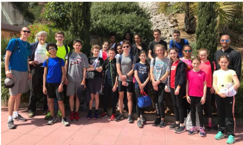
Le stage des jeunes en Espagne