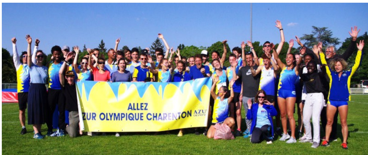
La victoire du match de poule aux interclubs