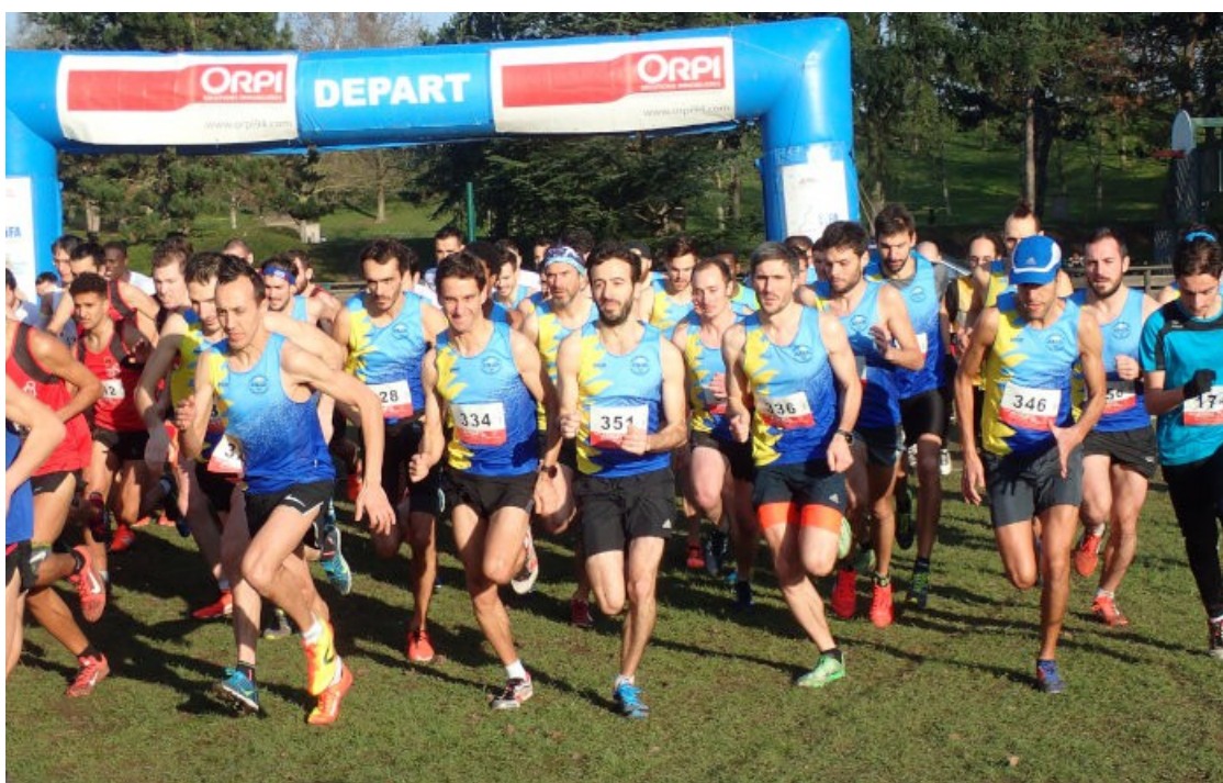
La marée bleue des championnats de cross...